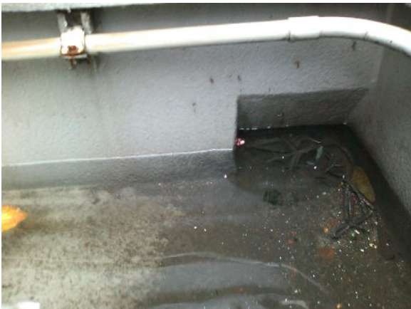
水が溜まり排水されない

下記の写真は「屋上排水口の詰まり」の写真ですが、台風の見回りの時に発見したものです。排水溝にゴミが詰まってしまい、屋上床面に10cm位の水が溜まっていました。