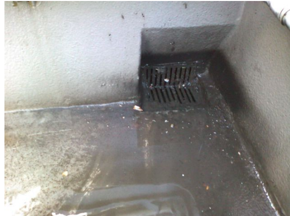
詰まりが解消されました